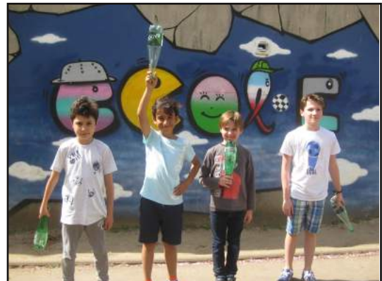
"Terre, ciel, menton, côté!"