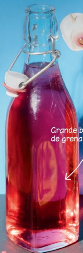
Grande bouteille de grenadine